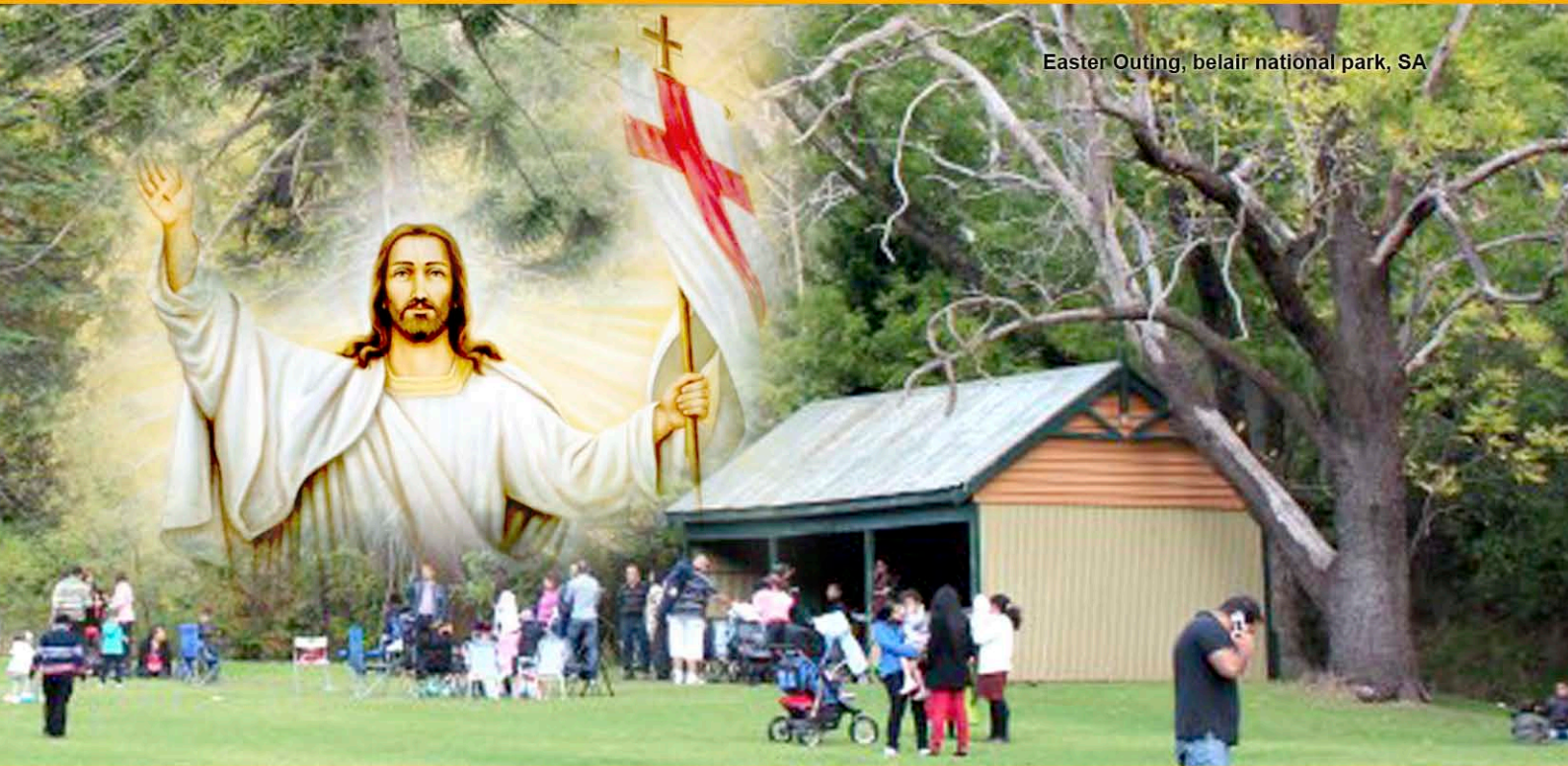
Easter Outing, belair national park, SA